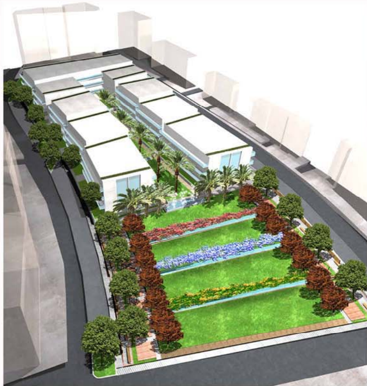
IL NUOVO INSEDIAMENTO VISTO DA SUD