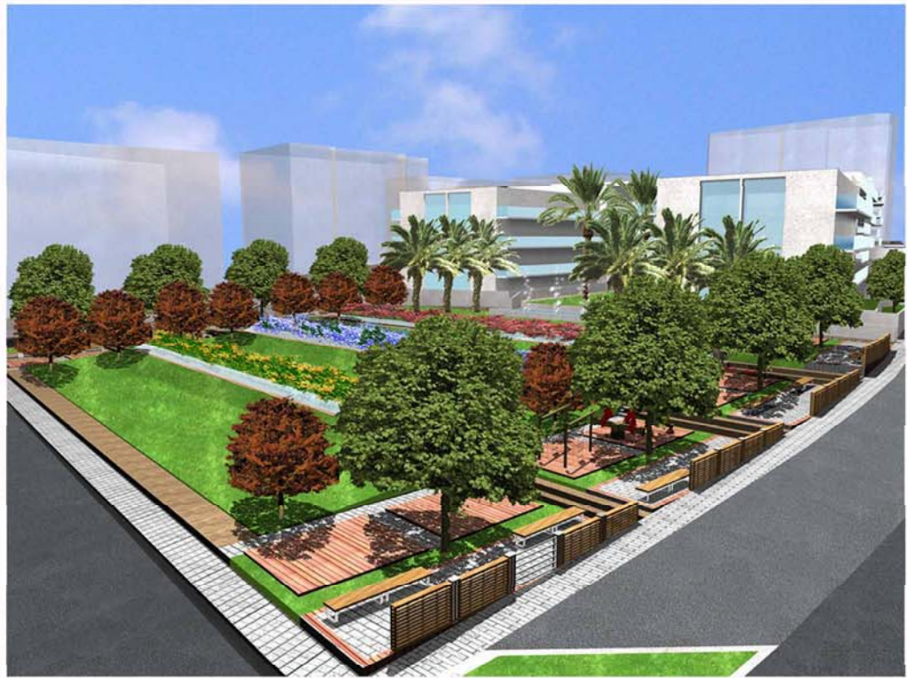
IL NUOVO INSEDIAMENTO VISTO DA VIA ARNALDO DA BRESCIA